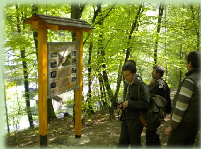
Z histórie Čermeľského údolia